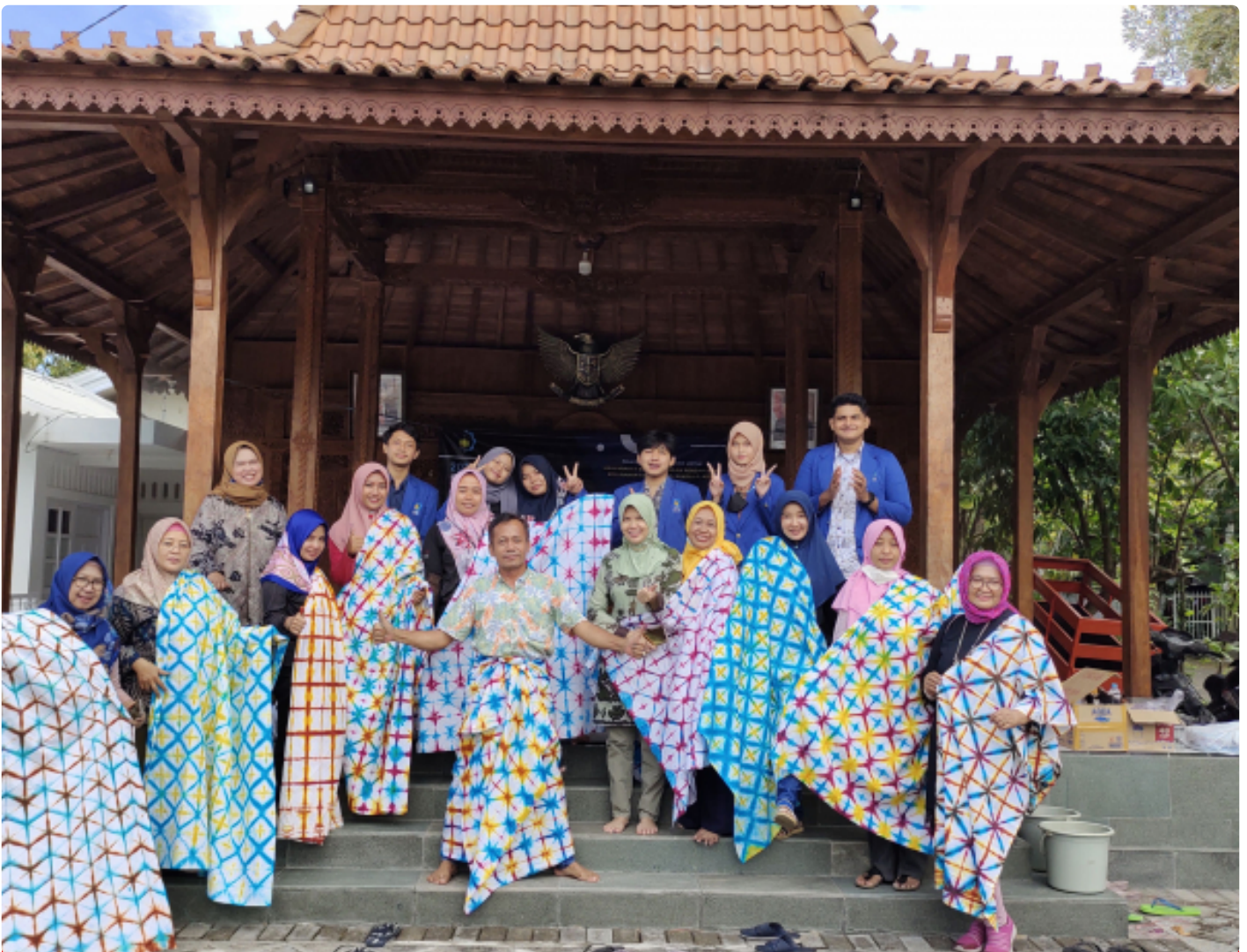
Para Peserta KKN Abmas Shibori menunjukkan hasil karyanya

SURABAYA – Tim Kuliah Kerja Nyata Pengabdian kepada Masyarakat (KKN Abmas) Institut Teknologi Sepuluh Nopember (ITS) mengenalkan Batik Shibori sebagai peluang bisnis yang besar. Maka dari itu, agar ITS selalu berkontribusi terhadap warga sekitar, pelatihan hingga pendampingan digelar dengan menyasar Masyarakat Berpenghasilan Rendah (MBR) Kelurahan Keputih.