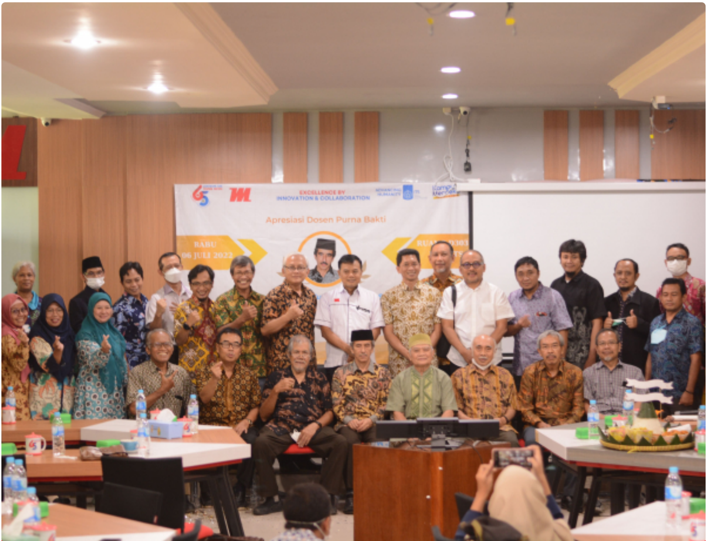
Keluarga besar Departemen Teknik Mesin ITS melakukan foto bersama sebagai simbol eratnya silaturahmi sesama

SURABAYA – Genap berusia 65 tahun, Departemen Teknik Mesin Institut Teknologi Sepuluh Nopember (ITS) gelar Kick Off Lustrum XIII Teknik Mesin. Acara yang bertajuk Excellence by Innovation and Collaboration ini mempertemukan keluarga besar Teknik Mesin ITS mulai dari dosen, tendik, hingga alumni secara luring di Departemen Teknik Mesin ITS dan secara berani lewat media Zoom, Rabu (6/7/2022).